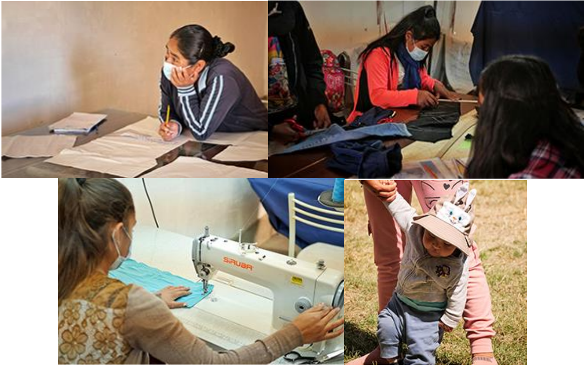
Le projet de Luz de Esperanza