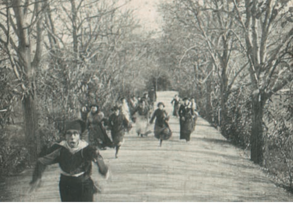
El heredero de la casa Pruna (1904)