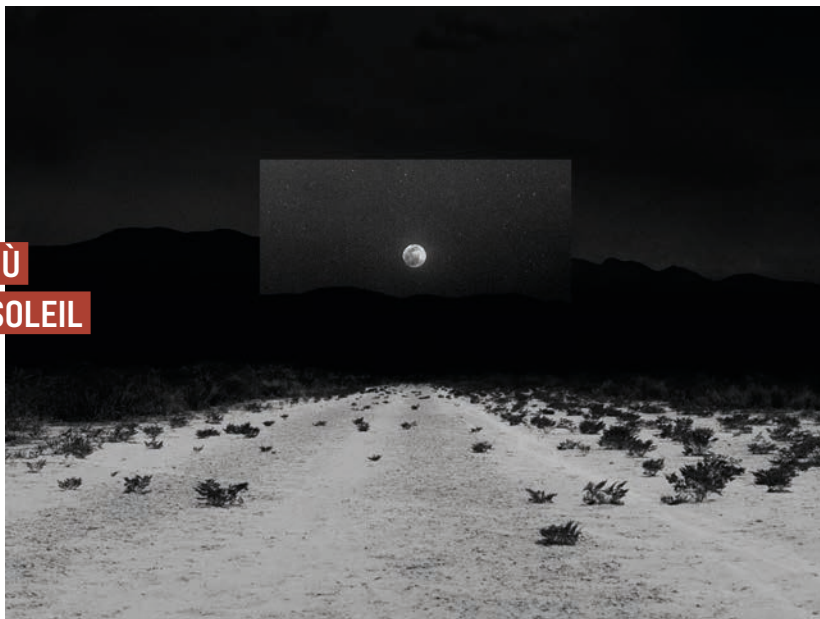
Après la cérémonie

Poursuivez le voyage avec l'expo événement du Centre du Patrimoine Arménien, présentée aux Rencontres d'Arles 2022