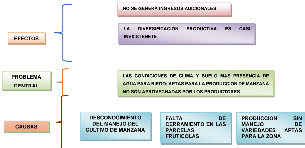
GRAFICO NO 1. Árbol de Problemas